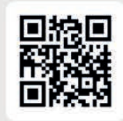
Muster eines QR-Codes